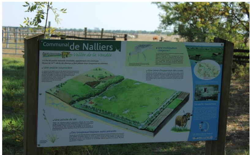
5. sz. kép Nalliers területe

terület nagyon száraz volt, több hónapja nem esett már csapadék, így a legtöbb gazda már hazaszállította állatait. A helyi vízügyi hatóság szakemberei légi felvételeket készítenek, mely alapján nagyon pontosan fel tudják térképezni a terület domborzati viszonyait és hidrológiai adottságait. A számítások elvégzését követően határozzák meg az adott legelőterület állatlétszámát, valamint, hogy az ideális vízkormányzást biztosító műtárgyakat és létesítményeket, hová helyezték el a területen.