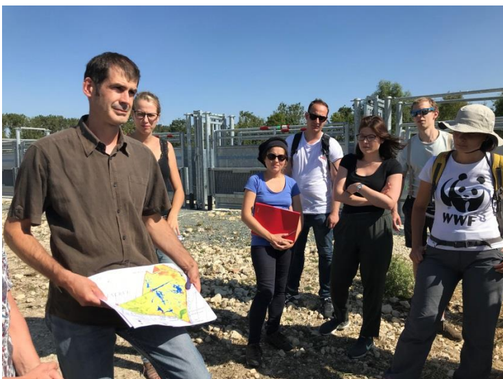
Önkormányzati Koordinációs Iroda

Ebéd után a csoport ismét buszra szállt és a francia vendéglátóinkkal közösen Poirée sur Velluire település irányába vette az utat, ahol Alain Remaud polgármester várta a résztvevőket. A polgármester úr köszöntője után a helyi, Ouest France folyóirattól érkezett sajtós munkatárs készített fotókat a résztvevőkről. A magyar csoport látogatásáról megjelent cikk az alábbi linken érhető el ( https://www.ouest-france.fr/pays-de-la-loire/les-velluire-sur-vendee-85770/le-poire-sur-velluire-des-elus-hongrois-au-communal-de-l-anglee-6532481 ).