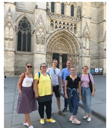
6. sz. kép Szent András katedrális, Bordeaux

2019. szeptember 18-án a reggelit követően buszra szállt a csapat és elindult Bordeaux városába. A repülőgép indulása előtt, szabad program keretében lehetősége volt a résztvevőknek egy pár órás városnézésre. Délután 13.00-kor elbúcsúzott a LIFE-MICACC csapata a francia vörös borok fővárosától és elindult a repülőtérre, ahol egy nem várt kellemetlenség fogadta a résztvevőket. Kiderült, hogy az amszterdami repülőtér csomagrakodói által meghirdetett sztrájk miatt törölték a járatunkat. A légitársaság nem értesítette sem a résztvevőket, sem az utazási irodát. Hosszú telefonálgatásokat követően az utazási iroda arról tájékoztatta a résztvevőket, hogy másnap két csoportra bontva fognak tudni hazautazni. Ahogy a mondás tartja „ Minden rosszban van valami jó ”, a résztvevők bár aznap nem tudtak hazautazni, de az utazási iroda a repülőtérhez legközelebb Lacanau városában tudta elszállásolni a 21 fős csoportot, ami az Atlanti-óceán partján fekszik. A