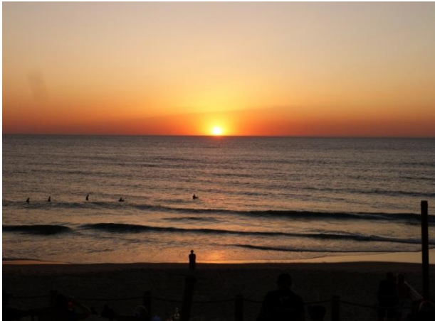
7. sz. melléklet Catanau, naplemente

legszerencsésebbek még a naplementét is láthatták az óceánparton. Másnap reggel két csoportban utaztak haza a résztvevők. Az első csoport délelőtt zürichi átszállással, míg a második csoport kora este Párizson keresztül jutott haza. Kalandos és kimerítő hazautazás ellenére, a résztvevők nagyon pozitívan értékelték a tanulmányutat, a megszerzett tapasztalatokat, élményeket.