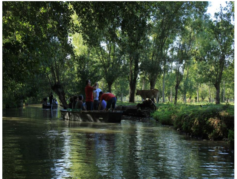
3. sz. kép Hajókirándulás

A terület 1979-ben kapta meg elsőként a nemzeti parki minősítést, melyet 1996-2014 között – a terület lecsapolása és az intenzív öntözéses mezőgazdasági tevékenység következményeként – elveszített, ebben az időszakban régiók közti park elnevezést használták. Hosszas társadalmi, és az érdekeltekkel történő egyeztetést követően 2014-ben került elfogadásra a Charte du Parc naturel régional du Marais Poitevin (2014-2026) dokumentum (alapokmány), mely meglátta a mocsárvidék nemzeti parki státuszának visszaszerzéséhez is feltétel volt. Az alapokmány a különböző érdekelt felek által került elfogadásra: regionális szervezetek, környezetvédelmi, természetvédelmi hatóságok, vízügyi