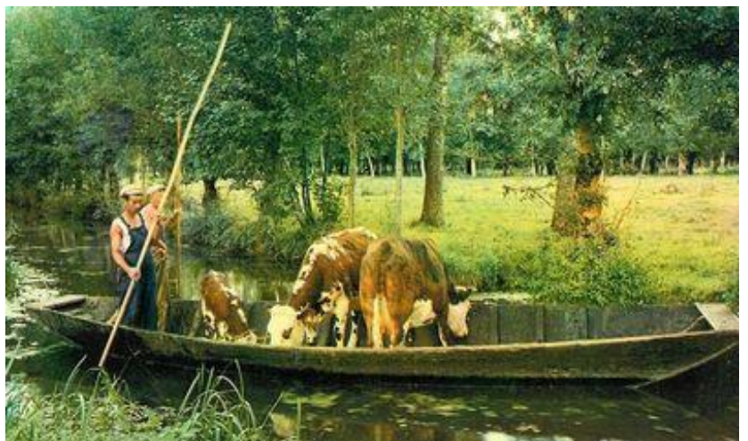
4. sz. kép Helyi gazda legeltetni viszi az állatait

igazgatóságok, önkormányzatok, helyi gazdák érdekvédelmi szövetségei, civil szervezetek. Franciaországban az egyes vízgyűjtőkön elterjedt egy úgynevezett „Contract de milieu” szerződésforma, melyben az egyes érintettek önkéntes alapon szerződésben rögzítik az ottani vízkészletek használatára vonatkozó szabályait, az élővizek kezelését, melynek célja egy kiegyensúlyozott vízkészlet-gazdálkodás megvalósítása. Több ilyen helyi megállapodás eredményeként született meg a 2014-ben elfogadott közös alapokmány, 12 éves időtartamra. A Nemzeti Park területén 2 régió, 3 megye és 91 település található. A nemzeti park területét 8.200 km csatornarendszer hálózta be, melyen 594 műtárggyal történik a vízkormányzás. A közel 200.000 hektár nagyságú területen elterülő parkra két típusú táj jellemző. A 2. sz. képen található sötétzöld területek jelölik a mocsárvidéket, melyeken extenzív ártéri legeltetés jellemző (szarvasmarha, ló, birka), míg a világoszöld területek a szárazabb térségeket jelzik, ahol az intenzív, öntözéses szántóföldi növénytermesztés a domináns. A fejlett vízkormányzó rendszernek, és a vízmegtartásra használt legelőknél illetve tározóknál hála, több egymást követő aszályos év után is van elegendő víz a csatornában. Az előadásokat követően a résztvevőknek lehetősége nyílt kérdéseik feltételére, azok